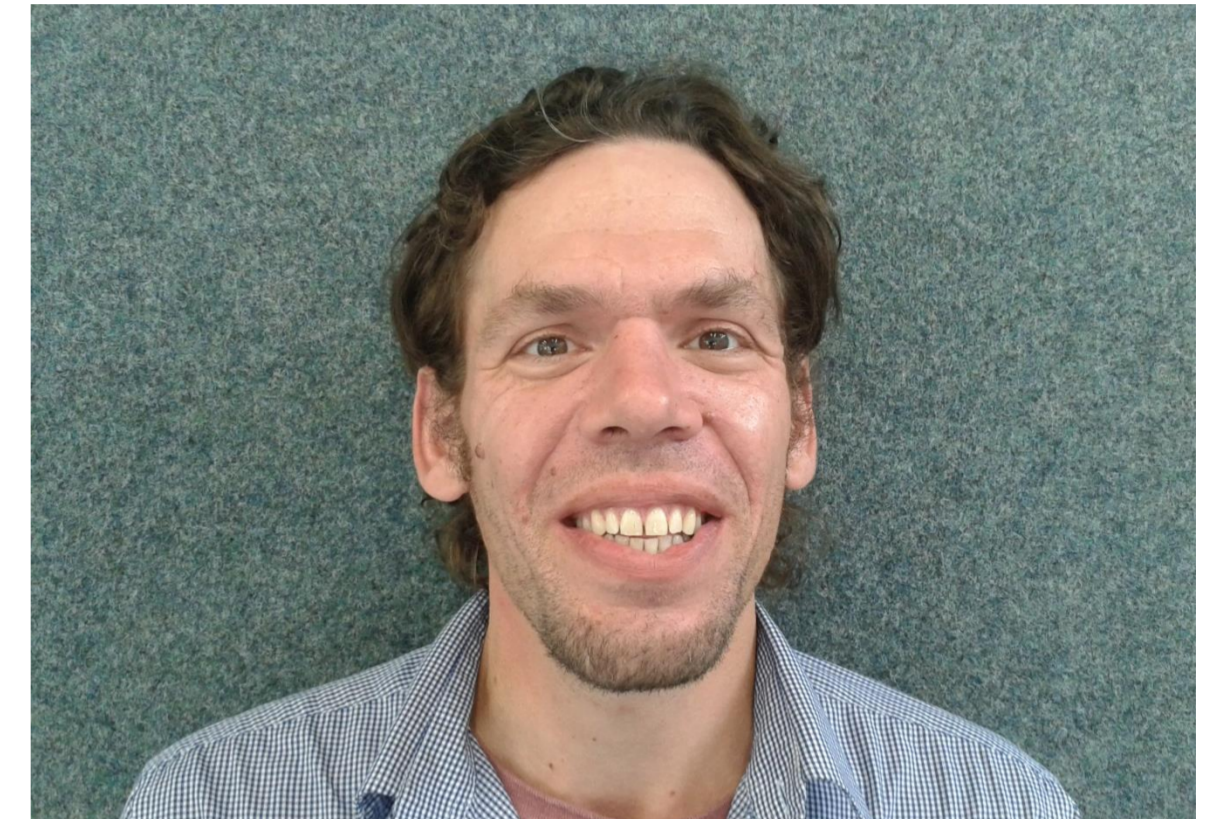
Team: Class Wiechmann

Videoprojekte wie z.B. „Roadmovies“ als pädagogische Angebote für Zielgruppen aus dem Bereich Jugendhilfe und perspektivisch für weitere Zielgruppen wie Senioren, die einen positiven Zugang zu Medien wie Video und Foto und den kreativen Umgang mit Medien fördert.