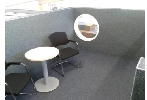
Brücke (4) , ein Teil vom Workshopraum (1)