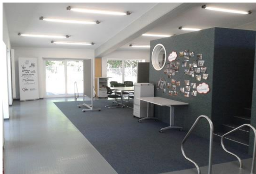
Plenumsbereich (2) , ein Teil vom Workshopraum (1)