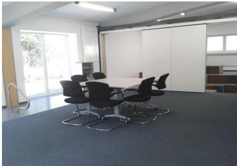
Plenumsbereich (2) , ein Teil vom Workshopraum (1)