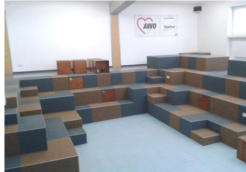
Becken (3) , ein Teil vom Workshopraum (1)