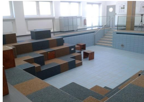
Becken (3) , ein Teil vom Workshopraum (1)