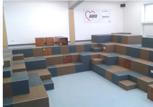
Becken (3) , ein Teil vom Workshopraum (1)